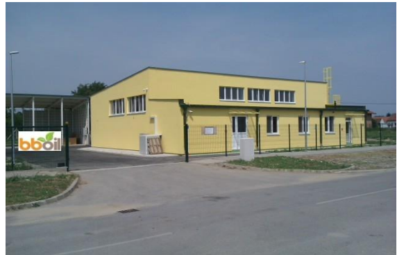
U srpnju je završena izgradnja pogona za proizvodnju hladno cijeđenih ulja u Bijelom Brdu – tvrtka „Bboil“ koju vodi Lidija , članica Panona