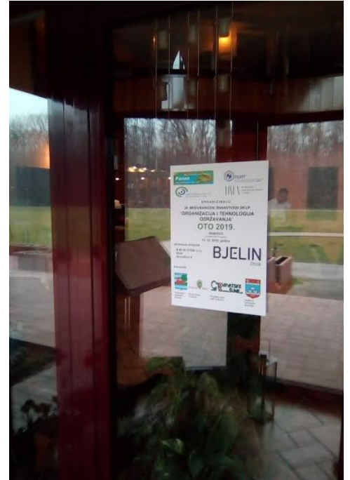
Ulaz u Lovački dom (Plakat OTO konferencije)