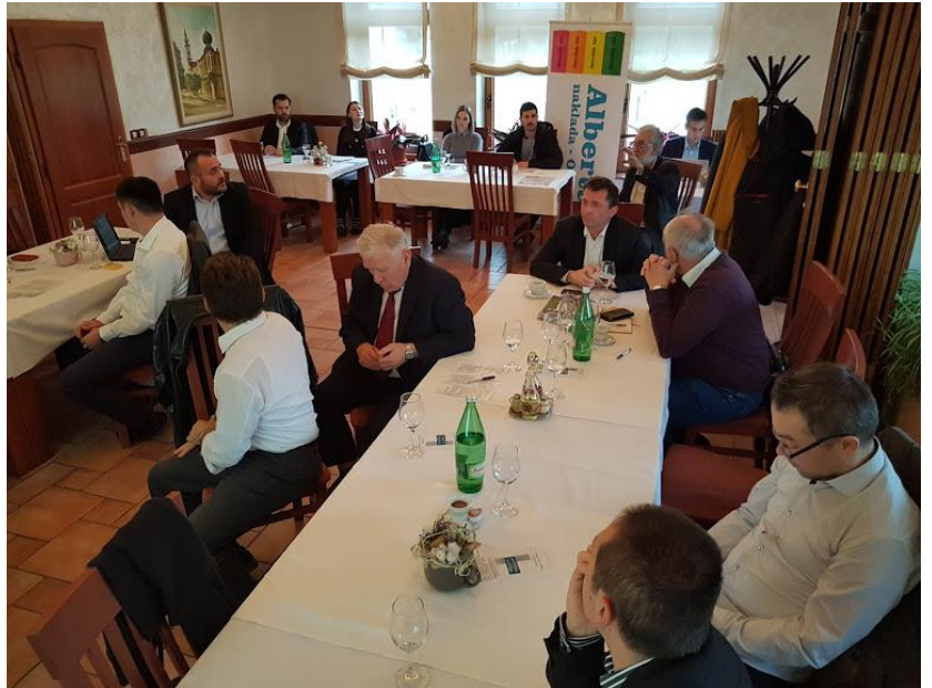
Rasprava nakon izlaganje referata i zaključci konferencije