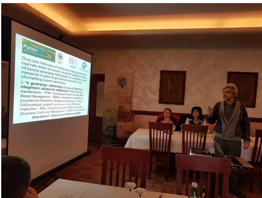
Držislav Vidaković „Karakteristike i područje primjene cjelovitog učinkovitog održavanja“