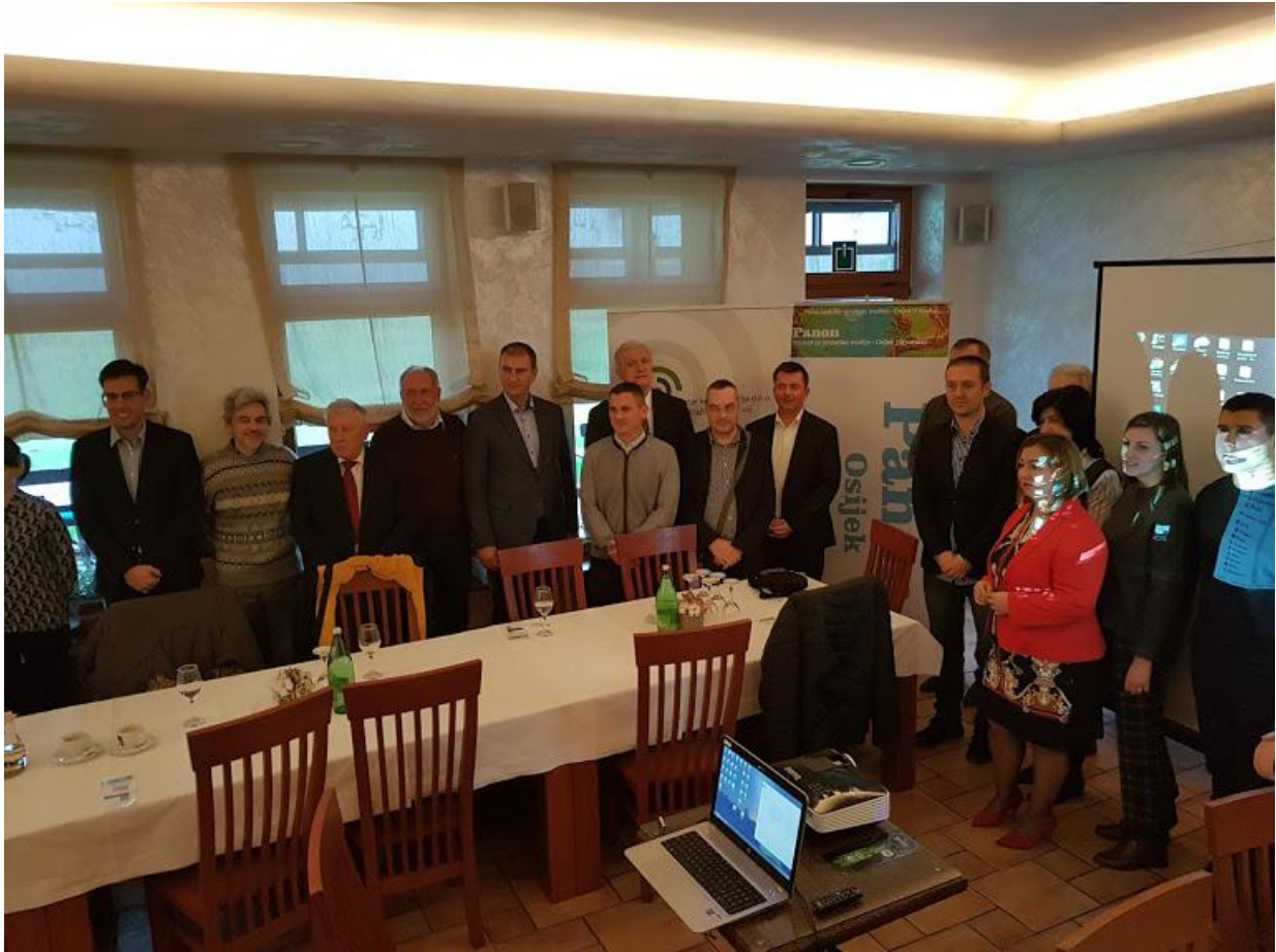
I na kraju – zajednički fotos