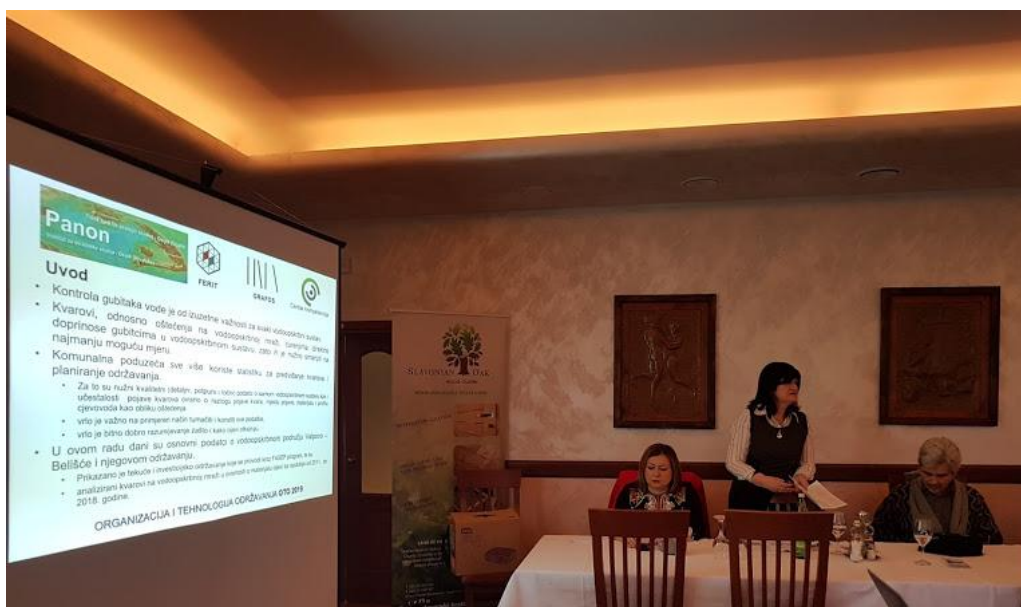
Tatjana Mijušković - Svetinović - „Održavanje vodoopskrbnog sustava Valpovo – Belišće“