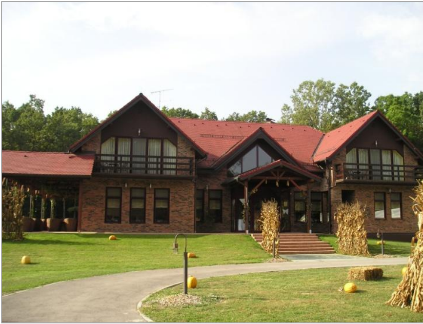
Lovački dom Kunjevci