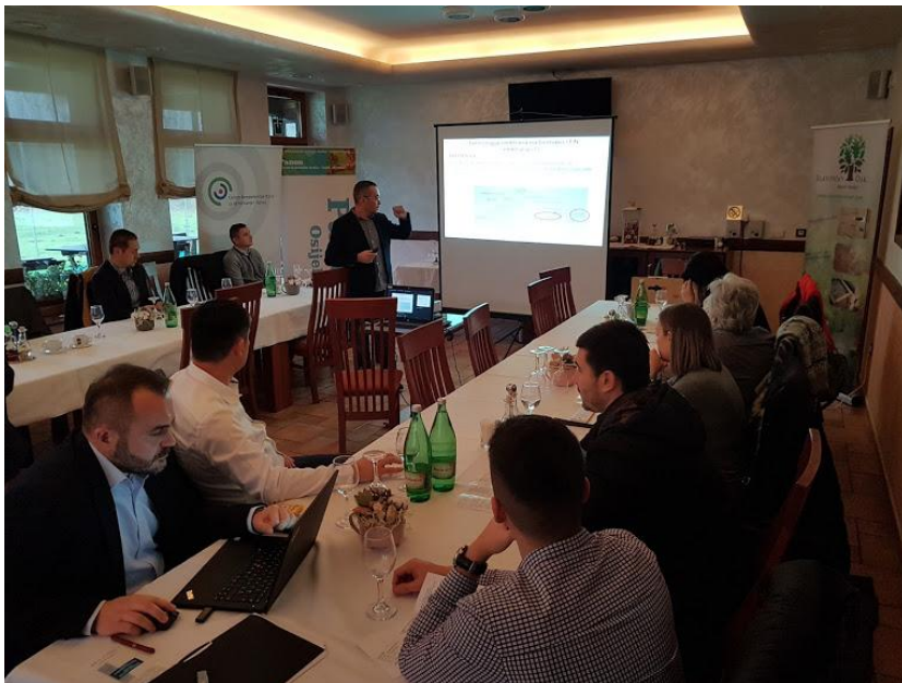
Krešimir Fekete - „Proračun struje kratkog spoja u srednjenaponskim mrežama sa priključenim obnovljivim izvorima energije“