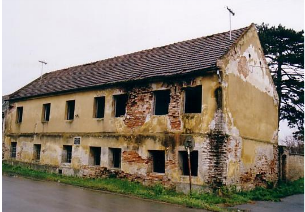
Rodna kuća Milutina Milankovića u Dalju (2006.)