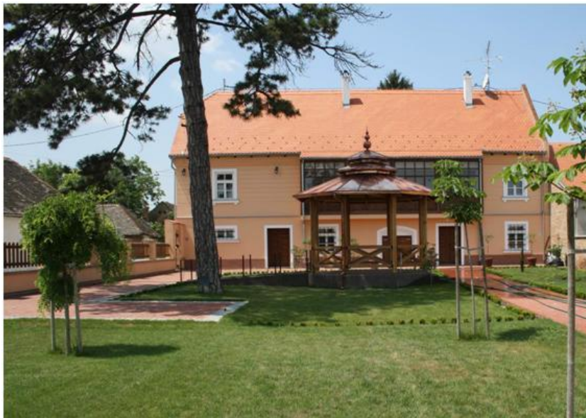
Rodna kuća Milutina Milankovića u Dalju (2009.)