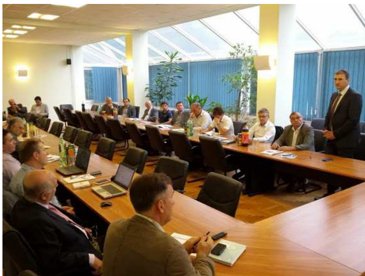
Sastanak o provedbi projekta „Slavonska mreža“; nazočni – predstavnici pet slavonskih županija i gradova s područje regije, ETF-a Osijek, Panon instituta, Tvrtke Ericsson Nikola Tesla d.d. Hrvatska i HAKOM-a (Elektrotehnički fakultet Osijek; 4. 9. 2014.)